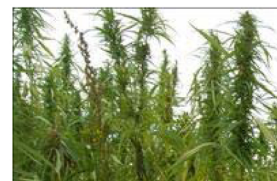
Tydelige han- og hunplanter. Hanplanten (th) har en mindre "frøstand" og danner ikke frø.