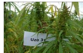
Gødskning af økologisk hamp til modenhed 2010.