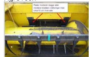
Tilpasning af mejetærsker til hampefrøhøst