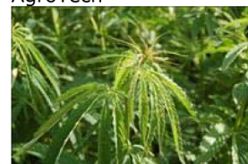
Hampeplanten bliver ofte mere end 2,5 meter høj. Hunplanterne er generelt mere kraftige