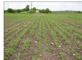
Etablering af hamp, AgroTechs biomark 2008