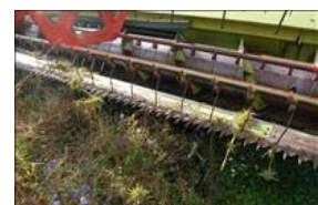
Kniven skal være skarpsleben.