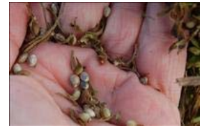
Frøene er oveervæjende modne, og brunlige.

Mejetærskeren indstilles med helt åben bro, således at de mange umodne frø vil