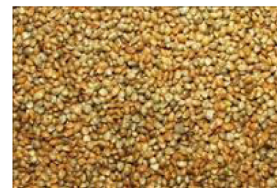
Modne hampefrø indeholder højværdi-olier og proteiner

Fibre har et meget højt indhold af cellulose på 71,6 pct. af tørstoffet, til