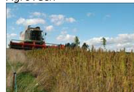
Høst af moden hamp, 2010. Landsforsøg Funder ved Silkeborg