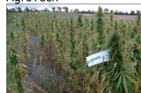
Hamp, sorten Finola, til modenhed. Landsforsøg ved Funder, Silkeborg 2010