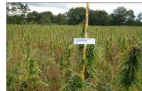
Økologisk dyrkningsforsøg i hamp 2010, ved Silkeborg.