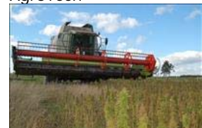
Mejetærskning af hamp til modenhed