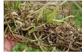
Hampefrøstand, Finola, Landsforsøg, Silkeborg 2010