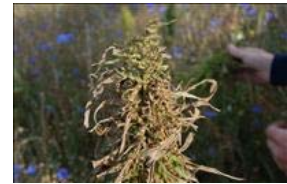
Angreb af fugle i hampeafgrøden kan være voldsomt, og er med til at sætte høsttidspunktet.

Se også valg af høsttidspunkt under høst af hamp.